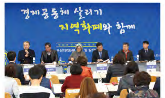
▲ 지난해 10월 열린 부천시 지역화폐 관련 시민정책토론회 모습.