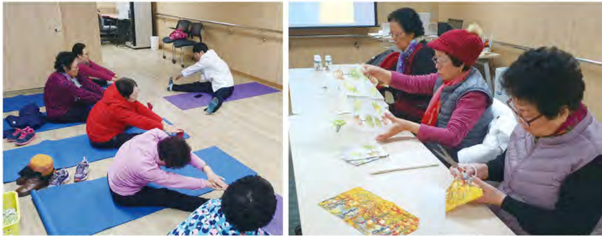
▲ 우리 시는 권역별로 치매안심센터를 개소하고 다양한 치매예방 프로그램을 운영한다. 사진은 소사치매안심센터 치매예방교실 운영 모습.

치매치료 · 돌봄 기능 강화한 치매통합관리사업 수행, 만 60세 이상 어르신 누구나 이용가능