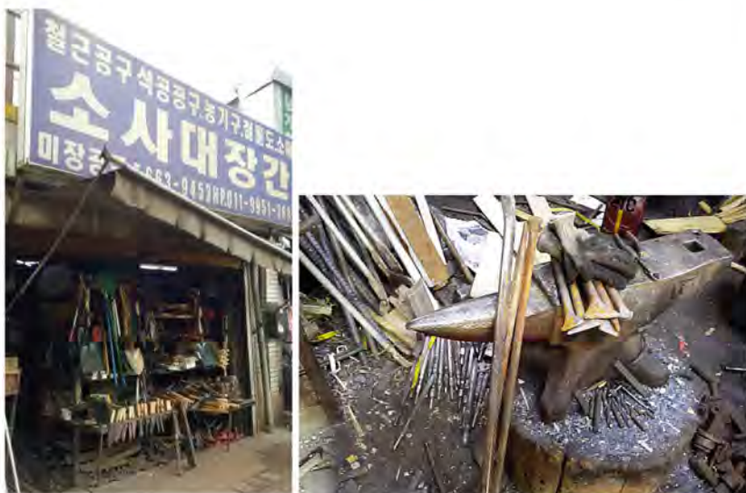
▲ 심곡본동에 부천 유일의 전통 대장간 '소사대장간'이 있다. 사진은 소사대장간의 모습과 대장간 필수 도구인 모루.