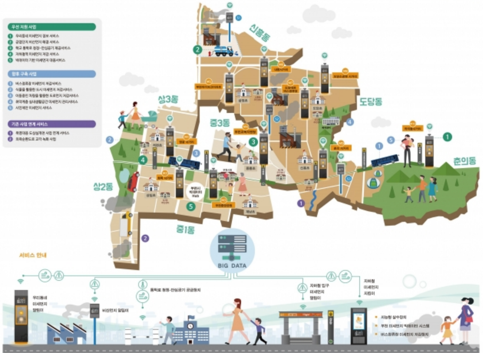
▲스마트 미세먼지 클린 특화단지

시는 빅데이터 및 인공지능 분석을 기반으로 정확하고 효과적인 미세먼지 대응방안을 제공해 시민이 공감하는 미세먼지 해결 기술기반을 구축할 계획이다. 미세먼지대책관실 625-3513