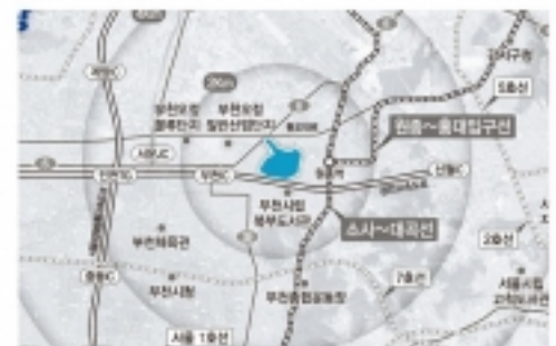
▲ 오정 군부대 이전이 확정되어 오는 2025년까지 친환경 스마트 주거단지가 조성될 예정이다. 사진은 오정 군부대 위치도.

개발 콘셉트는 원활한 교통환경을 제공하는 '소통하는 도시', 자연과 사람이 공존하는 '친환경 생태건강 도시', 미래형 스마트 기술을 접목한 '첨단 스마트시티'다. 2023년 착공해 2025년 사업을 완료할 계획이다.