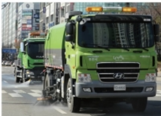
▲ 진공노면청소차에 연이어 고압살수차 청소 장면.