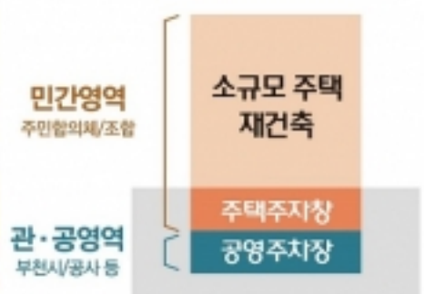
소규모주택 정비사업 추진모델 예시

제안했다. 두 번째 발제자로 나선 재해성 아주대 명예교수는 노후주택지역의 가장 큰 문제인 주차장 문제 해결방안 모델 제시했다.