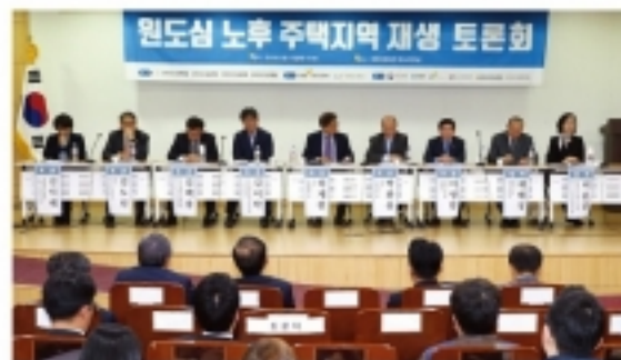
▲ 원도심 지역의 노후주택이 급속히 증가하는 추세에서 원도심 재생방안 마련을 위한 의미 있는 토론회가 개최되었다. 사진은 지난 3월 12일 국회의원회관에서 열린 토론회 모습.

소규모 정비사업과 도시재생 뉴딜사업·생활밀착형 SOC 확대를 연계하고, 커뮤니티시설·청년창업공간·공공임대주택 등의 제공에 따른 층수 및 용적을 완화도