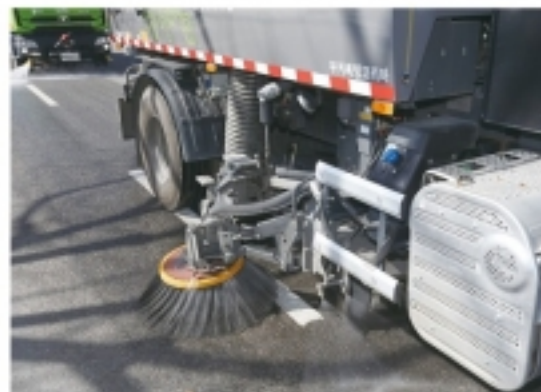
▲ 진공노면청소차 가동모습.