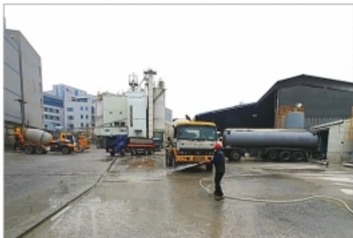
▲ 우리 시는 시민건강을 위협하는 미세먼지 대책에 발 벗고 나서고 있다. 사진은 비산먼지 배출 사업장으로 분류되는 관내 레미콘 공장의 물 뿌리기 모습과 경로당 등에 보급한 공기청정기.