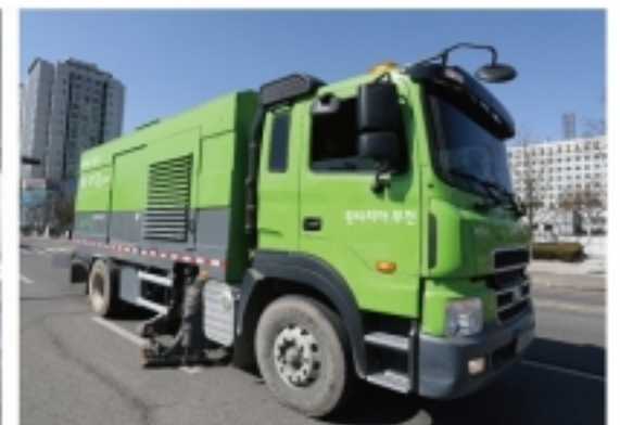
▲ 도로상 먼지를 강력하게 빨아들이는 분진흡입차.