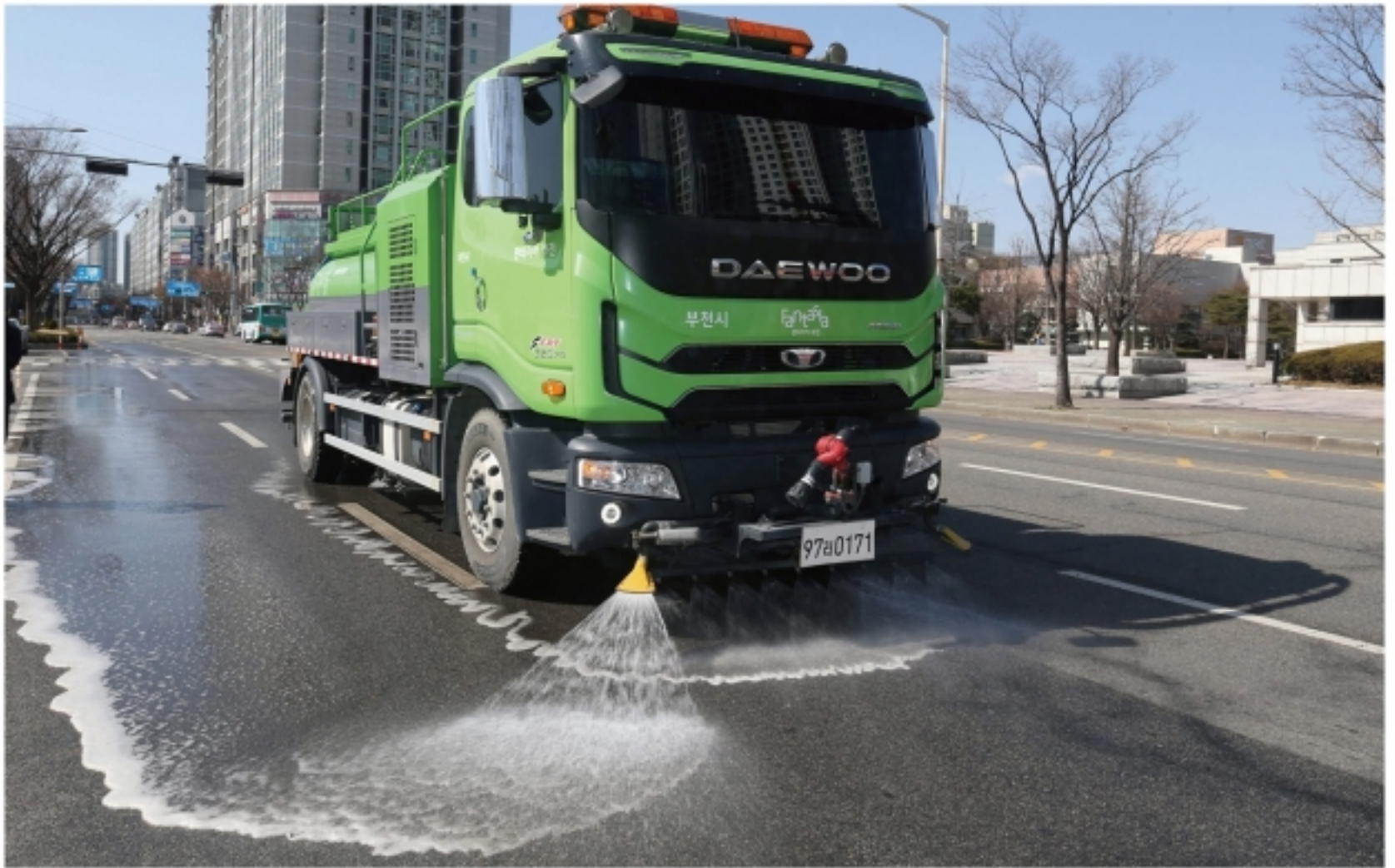
▲ 우리 시는 가로변 비산먼지 및 미세먼지 제거를 위해 진공노면청소차, 고압살수차, 분진흡입차 운영시간을 확대하고 있다. 사진은 고압살수차 가동 장면.

부천시 갈주로 210 | (032) 320-3000 | 발행 : 부천시 홍보실 | www.bucheon.go.kr